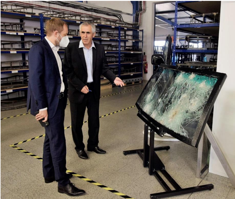
Pana ministra zaujalo čelní sklo z Toyoty Land Cruiser po útoku ozbrojenců na vozidlo české ambasády v září 2004 v iráckém Bagdádu